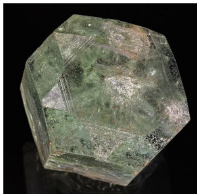
Aquamarin- Einzelspitze mit interessanter Endfläche (Stern), B: 5 cm, F: Marambaia, MG, Brasilien

Kollegen aus anderen Vereinen oder wenn sie stattfinden auch an den Zürcher Mineralientagen. Auch dieses Jahr hielt der Foto- und Bestimmungsabend diverse Herausforderungen für Felix bereit, die er gekonnt meisterte. Seine Analyse entsprach nicht immer dem vom Besitzer Erwarteten, was das Ganze natürlich noch spannender macht.