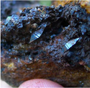
Wunderbare Anatase, gefunden von Remo Zanelli

Auch im September blieb sich das Wetter treu und war weiterhin sehr launisch - ohne längere stabile Schönwetterphasen. Im Val Bedretto war die Wettervorhersage zumindest für einen Teil des Tages 'ok'. Und so gings nach Paltano (TI) zu den Nadelquarzen. Mit etwas Glück konnte jeder etwas finden und das Wetter hielt 'grosszügigerweise' zumindest bis etwa Mitte Nachmittag, bevor sich der Himmel zügig verdunkelte. Wir machten uns auf in das einige Kilometer entfernt gelegene Cioss Prato in das sehenswerte Kristall-