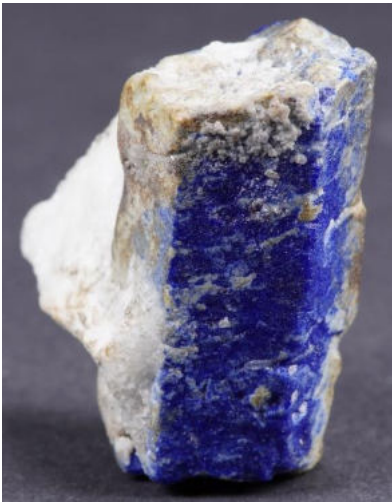
Pseudomorphose Lapis Lazuli nach Phlogopit, 35 mm Sar-e-sang, Afghanistan

Home Mine in den USA, die hauptsächlich Rhodochrosite liefert und auch der Greenlaws Mine, eine Fluorit Mine, ist kaum in Worte zu fassen – Prachtminerale, wohin das Auge blickt.