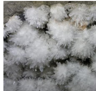
Ausschnitt aus einer nachgebauten mehrere Meter grossen Nadelquarz Kluft

museum . Es zeigt verschiedene nachgebaute echte Klüfte. Es wurde in Eigenleistung von Vater und Sohn