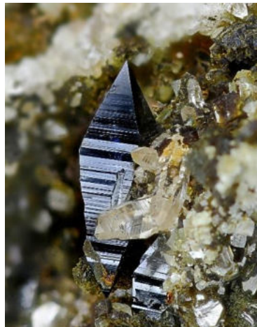
8mm grosser Anatas von Posmeda

Der SZM besteht aus den (gesetzgebenden) Mitgliedern sowie aus einem 5 bzw. 7-köpfigen Vorstand, der als Exekutive mit der Umsetzung der Projekte und Beschlüsse betraut ist. Das Handeln der Mitglieder des Vorstandes richtet sich nach den Statuten, welche bei Bedarf aktualisiert werden. Unser Verein ist verpflichtet, 1x pro Jahr die sog. Hauptversammlung durchzuführen, die vom Vorstand einberufen und geleitet wird. Geschäfte bis CHF 500.— sind in der Kompetenz des Vorstandes, über höhere Beträge entscheidet die Hauptversammlung.