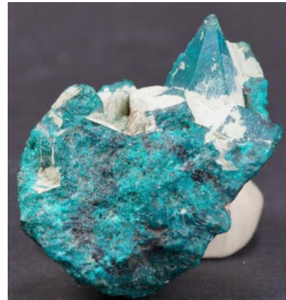
Pseudomorphose Diopside nach Kalzit, Sammlung und Bild Felix Mattenberger

Felix verstand es, das vielfältige und spannende Thema so