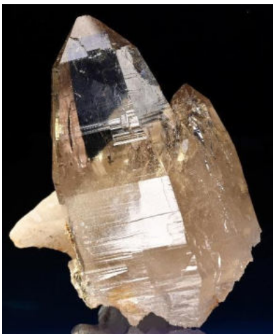
Quarz, Tessiner Habitus, H: 6 cm, F : Val Cavagnolo, TI