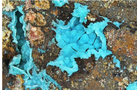
Chrysokoll Rotenbach

Mineralieninteressierte sind vor allem die im oberen Teil des Wiesentals gelegenen Erzgänge rund um Todtnau und den Silberberg von Interesse.