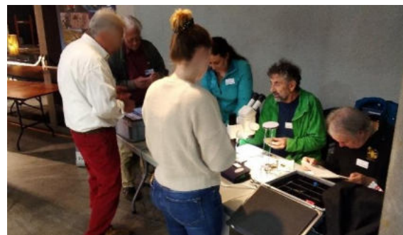
Unsere Expertinnen und Experten am Bestimmungsstand hatten alle Hände voll zu tun

Unser Bestimmungsstand war sehr gut besucht, manchmal bildete sich sogar eine Schlange davor. Der Bestimmungsstand entspricht einem Bedürfnis der Messebesuchenden. Die grosse professionelle