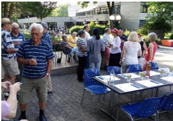
Die Teilnehmenden am Jahresmitteabend in sommerlicher Kleidung

Da es zwei Jahre lang keinen gemeinschaftlichen Anlass mehr geben durfte, hatte