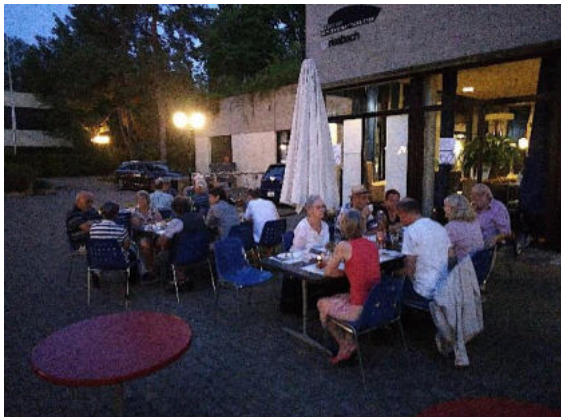
Der gemütliche Abend zu vorgerückter Stunde.

der Vorstand einen Jahresmitteabend im Sommer ins Leben gerufen. Wir hatten grosses Glück mit dem Wetter und die Teilnehmenden konnten vor dem GZ Riesbach grillieren und den für die Jahreszeit sehr milden Abend draussen geniessen. Der Abend bot die Gelegenheit, sich nach langer Zeit wieder in einem grösseren Kreis zu treffen und sich in entspannter Atmosphäre auszutauschen.