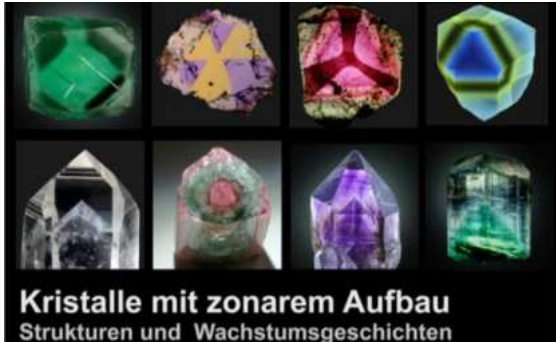
Kristalle mit zonarem Aufbau Strukturen und Wachstumsgeschichten