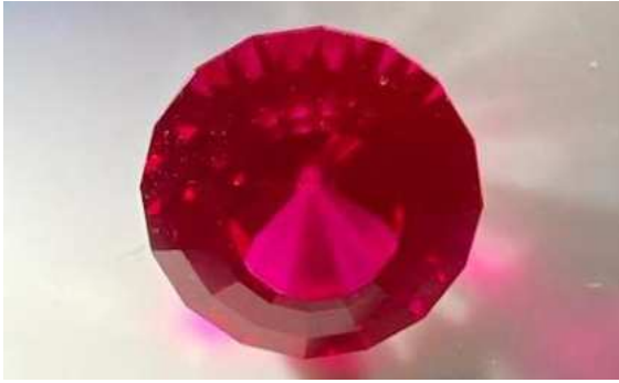
Das preisgekrönte Kleinod in seiner vollen Pracht.

An dieser Stelle ganz herzliche Gratulation Edi zu diesem schönen Erfolg.