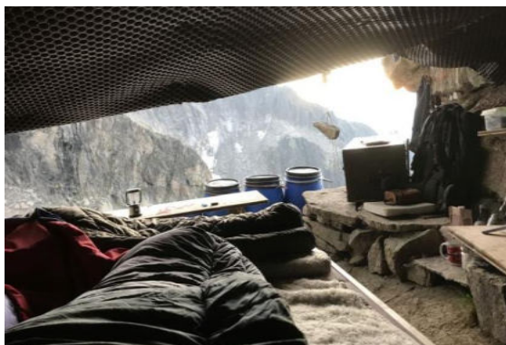
Das sehr gut ausgebaute Basislager weit oberhalb der Albert Heim Hütte.

Kanton Uri. Sein überaus gelungener Vortrag aus Präsentation, Filmsequenzen und vortragen eines Artikels gab uns einen tiefen Einblick in das anstrengende, aber auch sehr beglückende Strahlerleben, wenn es einem