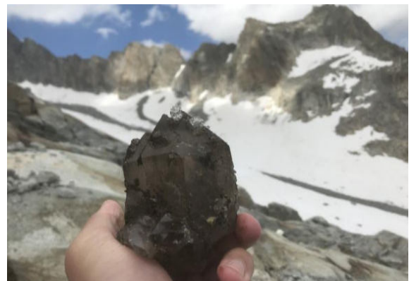
Ein wunderbarer bergfrischer Rauchquarz